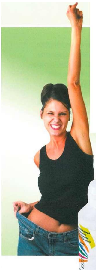
QuantaMin ® v. V. 90 kapsül (57-)